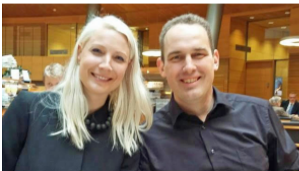
Kuvissa eduskunnassa, kahvilla varapuheenjohtaja Laura Huhtasaaren kanssa ja vaalikentällä puhumassa.